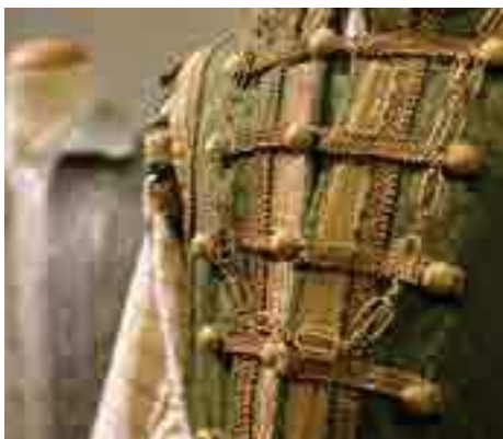
VITA DI CORTE