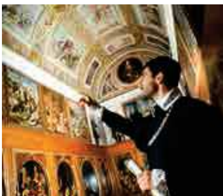
GUIDATI DA GIORGIO VASARI