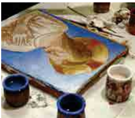
IN BOTTEGA: DIPINGERE IN FRESCO