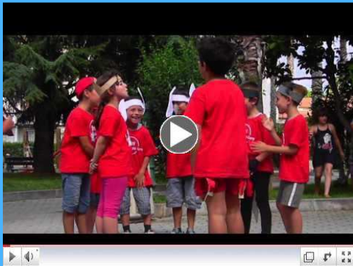
Cos'e l'English Camp?